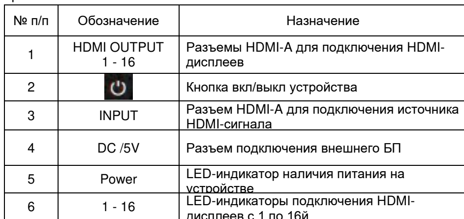
Таб.1 Назначение разъемов, кнопок и LED – индикаторов HDMI-разветвителя D-Hi116/1